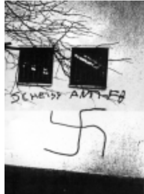
Nazischmierereien am Minimal Markt in der Broitzemer Straße

lingrad erleben. Da sie das scheinbar selber wissen, haben sie sich nun offensichtlich darauf verlegt, erstmal an ihrem heimischen Treffpunkt am Madamenweg einzelne Menschen anzugreifen.