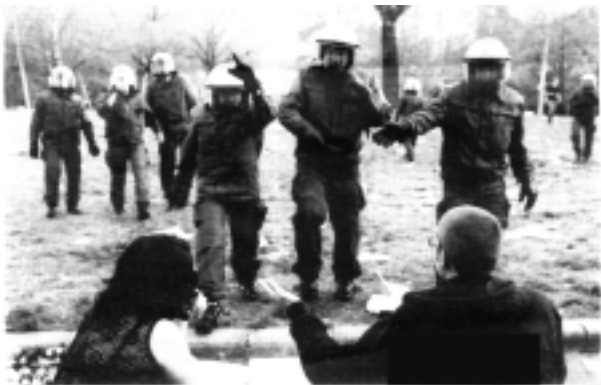
Bald Alltag im Prinzenpark?

auch unaufmerksamen BeobachterInnen nicht entgangen, dass eine Vielzahl von ParkbenutzerInnen sich offensichtlich an Zwang und Vorschriften zur Führung ihres Lebens so gewöhnt haben, dass auch die scheinbare Abwesenheit jener sie nicht mehr zu simpelsten eigenen Überlegungen bspw. der Art bewegen kann, dass ein zugemüllter Park am nächsten Tag weit weniger nett ist. Das soll nun jedoch staatlicherseits nachgeholt werden: Streifenpolizisten, Hunde-